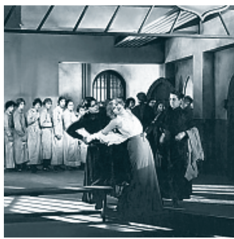
Eine der ersten Regiearbeiten einer Frau im deutschen Kino: „Mädchen in Uniform“ (1931) von Leontine Sagan.