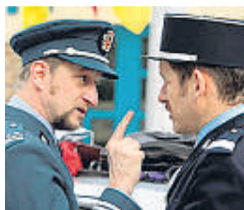
Belgisch-französischer Disput: Ruben (Benoit Poelvoorde, l.) und Mathias (Dany Boon, r.).

Dany Boon macht die beiden zum Gespann wider Willen. Zunächst in einer nostalgisch eingefärbten Szenerie mit Grenzbäumen,