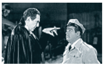
Nachtgeschöpfe wie Dracula fürchtet Lou Costello (r.) nicht.

Als man auf die Idee kam, Abbott und Costello in das Reich des Unheimlichen zu entsenden, war das auch vom Interesse an einer Form von Zweitverwertung geprägt. Denn Stars wie Lon Chaney Jr. oder Bela Lugosi waren zum Teil so eng mit ihren Figuren verbunden, dass sie es schwer hatten, ihre Karriere davon abzulösen. Man konnte also von Synergien sprechen, als Abbott & Costello 1948 ein Abenteuer zu bestehen hatten, in dem die altbekannte Verwirrung zwischen Frankenstein und seiner Kreatur schon im Titel auszuschmen ist: „Abbott & Costello treffen Frankenstein“ – gerade das trifft im strengen Sinn nicht zu. Aber sie treffen den Wolfsmann, Graf Dracula und schließlich das Monster selbst, das zu seinem mächtigen Körper nun auch noch ein Superhirn eingepflanzt bekommen soll, wofür ausgerechnet das von Chick Young auserkoren wird, also das von Lou Costello.