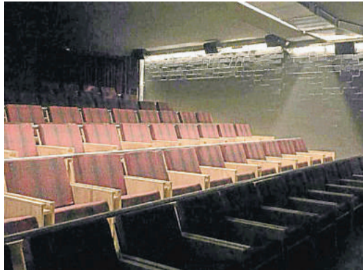
Breite Sessel im Kino Eiszeit (l.) und Ledersitze im Kino Astor sollen Bequemlichkeit bieten.