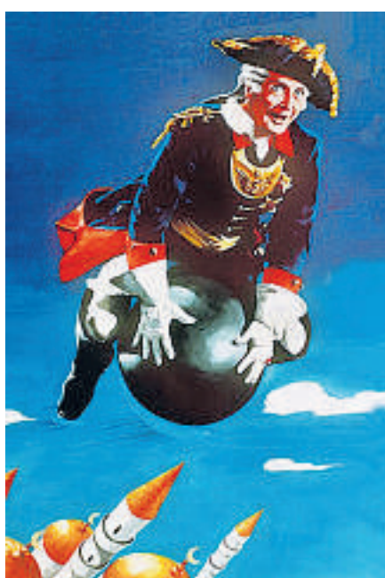
Mit diesem Plakat wurde für den UFA-Farbfilm „Münchhausen“ (1943) geworben.

Schauer auch Faszination. Denn die großartig präsentierten Abbildungen machen auch bewusst, wie einzigartig Agfacolor war. Die Farben wirken ungleich dezenter, pastelliger, weicher; die Autoren sprechen von lyrischeren Farben „mit einem Hauch von Noblesse“. Es entsteht ein deutlich anderer Bildeindruck als der des eher schreiend bunten Technicolors aus Hollywood. Wie unterschiedliche technische Standards zu vollkommen unterschiedlichen Seheindrücken führen, ist nebenbei eine weitere Erkenntnis, welche sich aus dem filmhistorischen Kapitel zum Thema „früher Farbfilm“ ergibt.